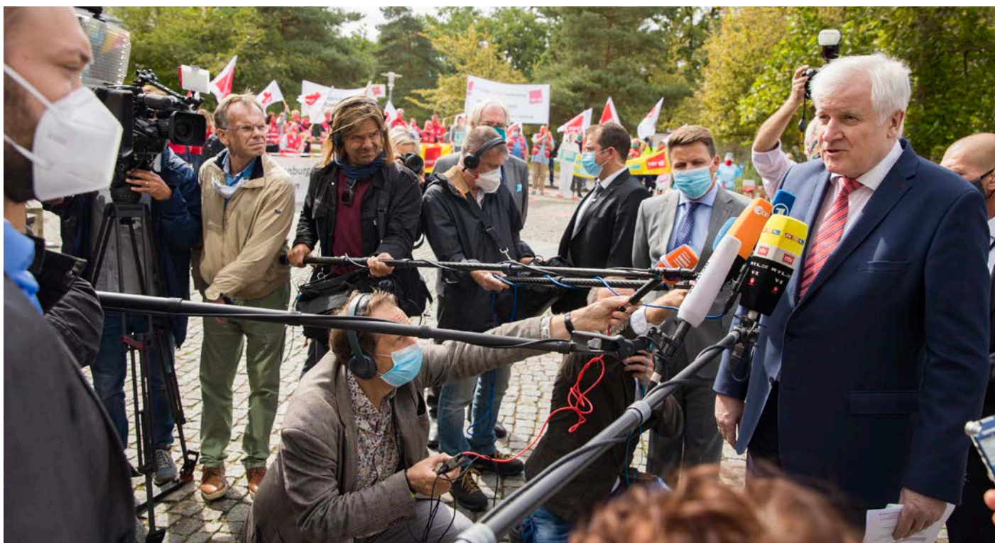
Bundesinnenminister Seehofer vor Beginn der Verhandlungen in Potsdam.

Wir bleiben dabei – unsere Forderung nach Einkommenserhöhung um 4,8 Prozent, mindestens aber um 150 Euro, ist mehr als gerechtfertigt!