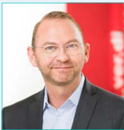
Frank Werneke ver.di-Vorsitzender

„Das ist unter den derzeitigen Bedingungen ein respektabler Abschluss, der für unterschiedliche Berufsgruppen, die im Fokus der Tarifrunde standen, maßgeschneidert ist. Besonders erfreulich ist, dass es uns gelungen ist, deutliche Verbesserungen für untere und mittlere Einkommensgruppen sowie für den Bereich Pflege und Gesundheit durchzusetzen.“